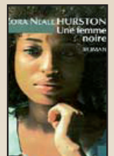
➤ Une Femme noire, de Zora Neale Hurston - Editions de l'Aube, 2006